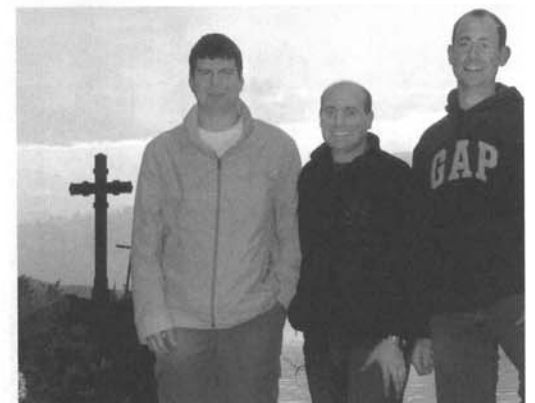
Tauchausflug ins Salzkammergut.

Die Sichtverhältnisse am Attersee waren überraschend gut. Der Mondsee dagegen ist im Vergleich dazu sehr trüb und bietet nur mäßige Sichtverhältnisse. Den Wolfgangsee wollen wir noch mal betauchen, um uns ein endgültiges Bild zu machen.