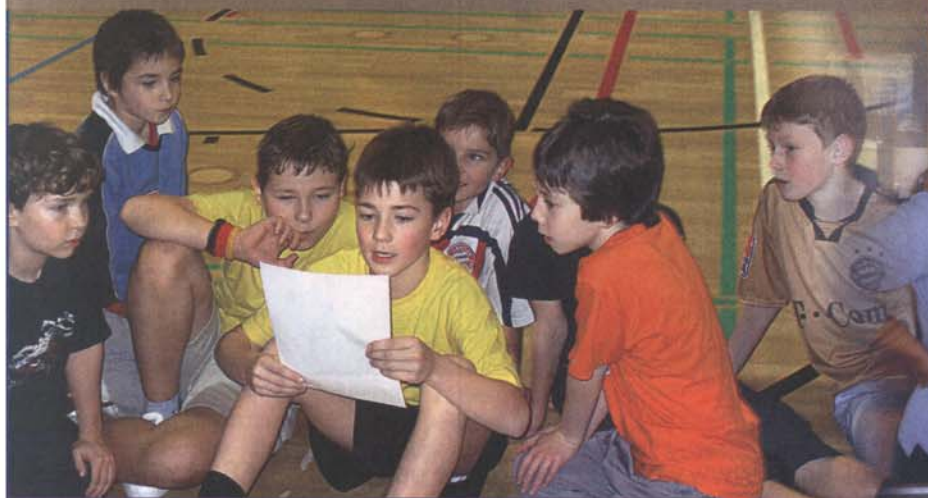
TSV-Jugend feiert Nikolaus