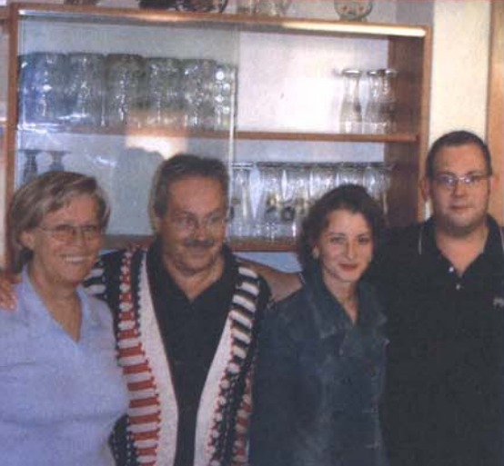
Neue Wirtsleute am Tennisplatz