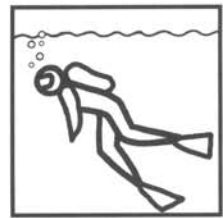
Antauchen bei frischen zwei Grad.