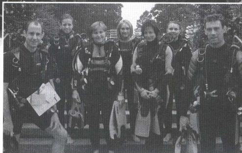
Teilnehmer des Tauchkurses und Schnuppertauchens.