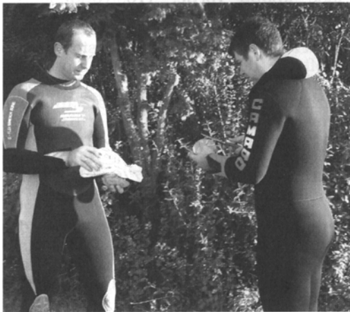
Nach so viel Sport ...

Obwohl sich der Sommer in diesem Jahr vornehm zurückgehalten hat, bzw. praktisch nicht stattgefunden hat, haben wir unsere regelmäßigen Stammtischtermine (jeder zweite Donnerstag im Monat) für Tauchausflüge in die nähere Umgebung genutzt. Aber auch zwischen den Terminen waren wir fleißig unterwegs und damit unter Wasser.