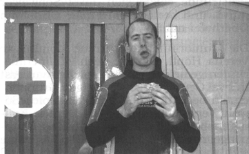
... ein Bier und etwas essen. Lecker!