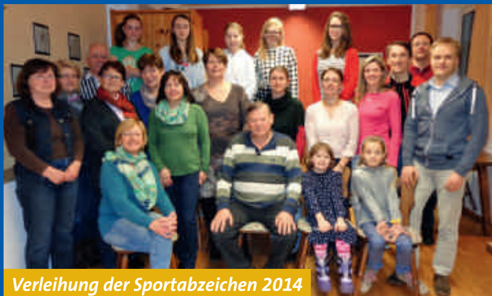
Verleihung der Sportabzeichen 2014