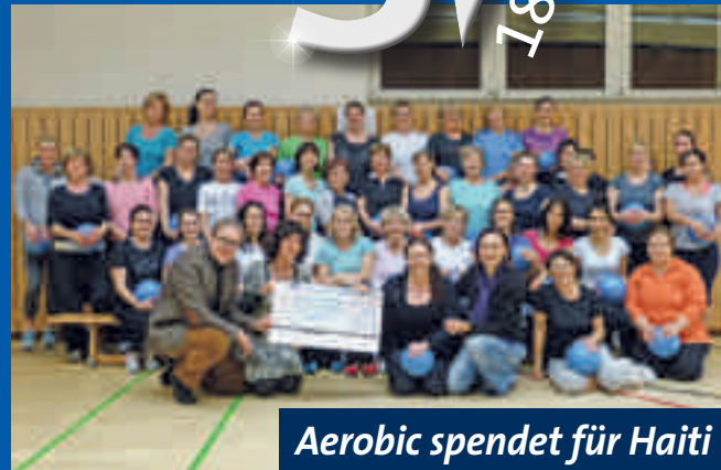
Aerobic spendet für Haiti