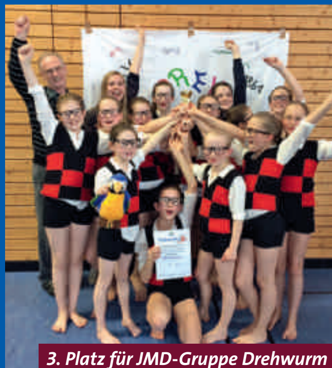
3. Platz für JMD-Gruppe Drehwurm